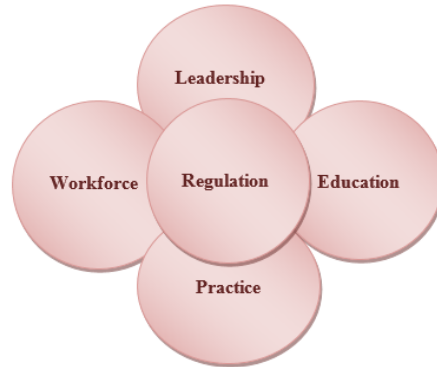
مجالات أولويات البحوث في التمريض

تهدف الأولويات البحثية في التمريض والقبالة إلى توجيه الباحثين نحو وضع الأبحاث العلمية التي تخدم الحاجات الصحية الوطنية، وتدعم الممارسة المبنية على أسس علمية، وقد تم تصنيفها إلى خمس مجالات بحثية رئيسية بما في ذلك تنظيم المهنة، والقيادة التمريضية، والقوى البشرية العاملة في المهنة والتعليم والممارسة، بالإضافة إلى إدراج خمسة إلى سبعة من الموضوعات البحثية تحت كل مجال.