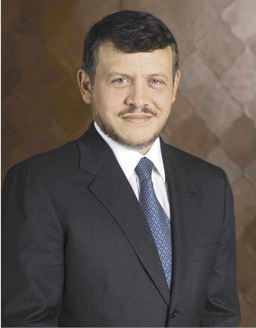
جلالة الملك عبد الله الثاني ابن الحسين المعظم