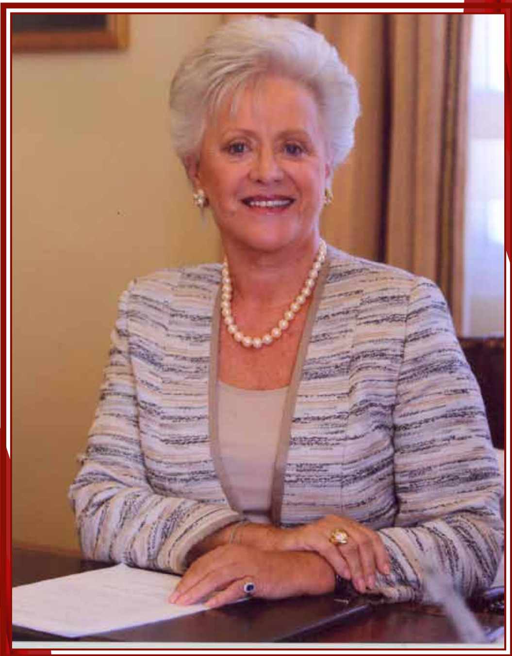
صاحبة السمو الملكي الأميرة منى الحسين المعظمة رئيس المجلس التمريضي الأردني