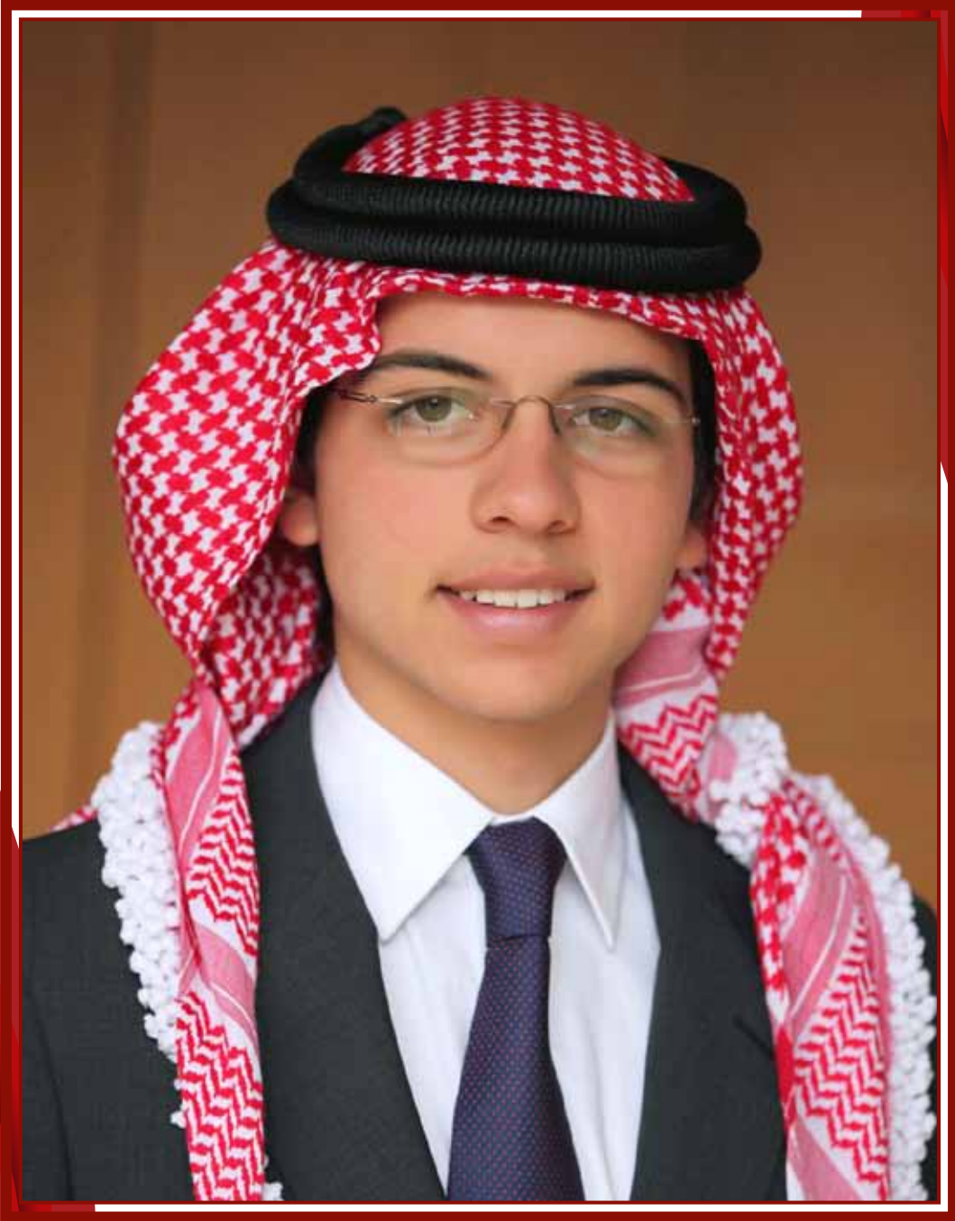
ولي العهد الأمير الحسين بن عبد الله الثاني