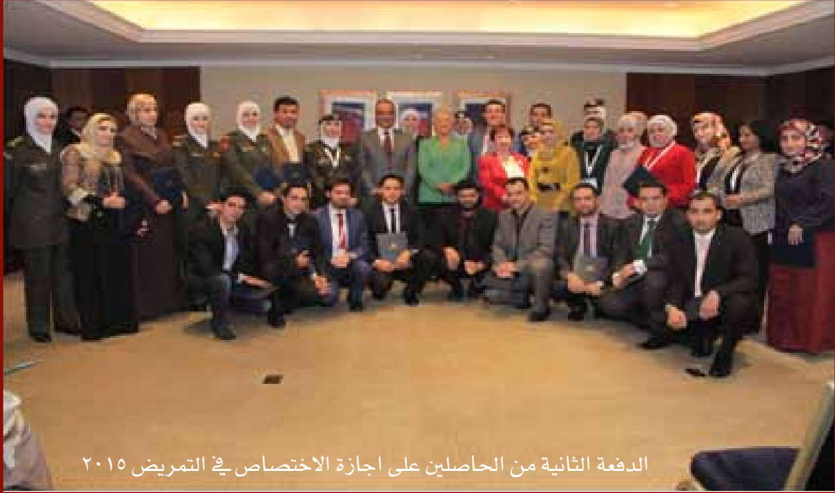
الدفعة الثانية من الحاصلين على اجازة الاختصاص في التمريض ٢٠١٥