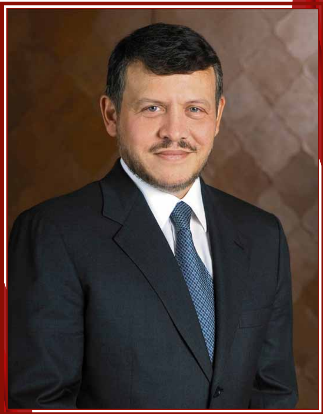
جلالة الملك عبد الله الثاني ابن الحسين المعظم