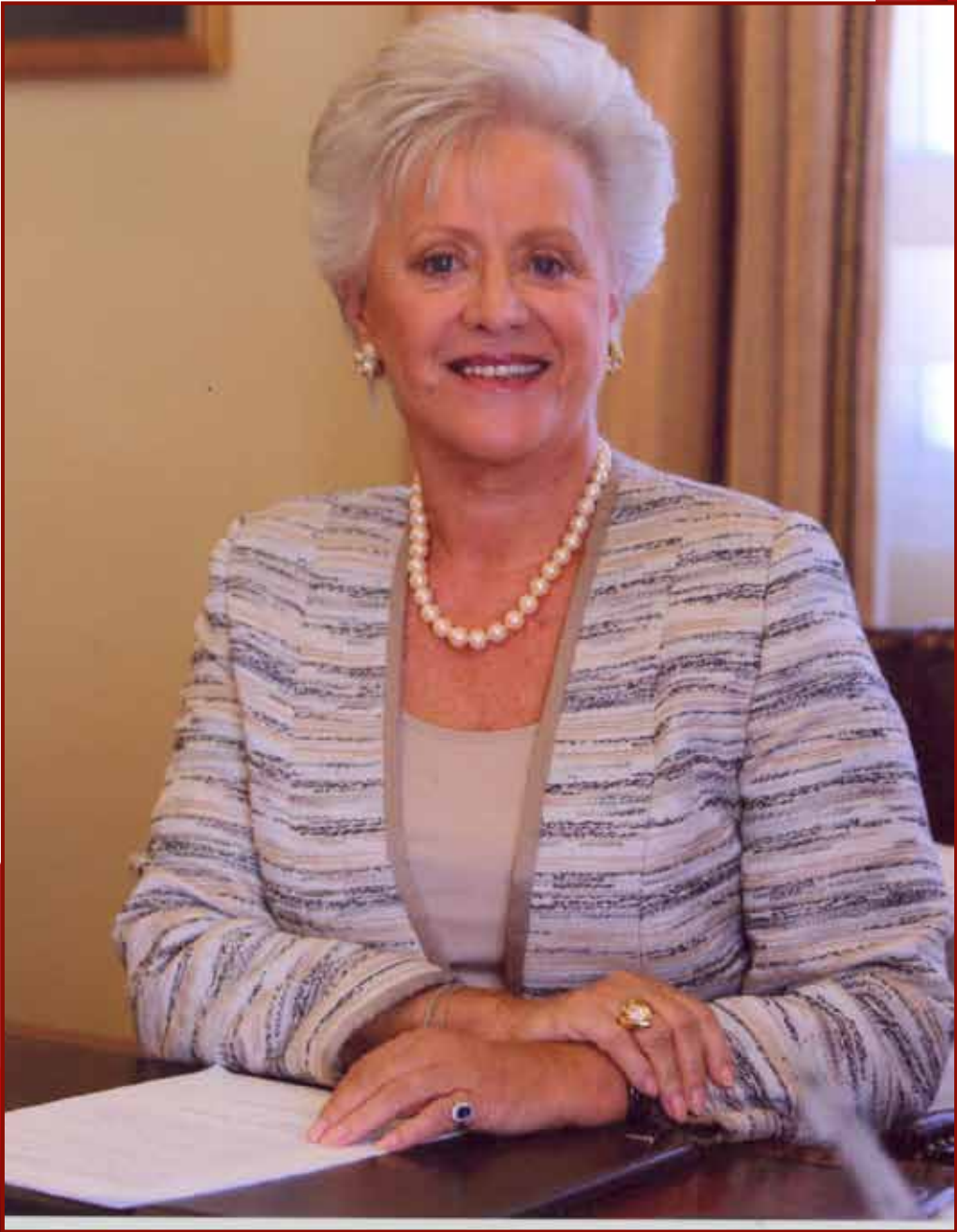
صاحبة السمو الملكي الأميرة منى الحسين المعظمة رئيس المجلس التمريضي الأردني