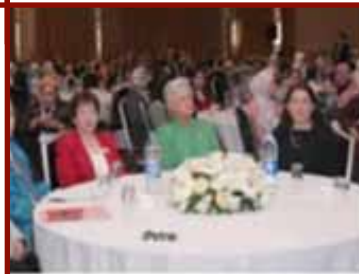
التمريض في الأردن: من أجل جودة الرعاية الصحية