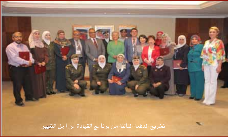
تخريج الدفعة الثالثة من برنامج القيادة من أجل التغيير

بدأ المجلس بتنفيذ الدورة الرابعة من البرنامج بشهر تشرين الاول من عام ٢٠١٥ باشتراك (٢٧) ممرض وممرضة من ستة مؤسسات صحية تمثل القطاعات الصحية من وزارة الصحة، الخدمات الطبية الملكية، والقطاع الصحي الخاص.