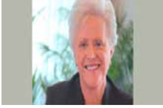
”ألتزم بدعم التشريعات التي تعزز الأدوار المتخصصة في التمريض لتجويد الرعاية المقدمة لمجتمعنا الأردني“

رعت صاحبة السمو الملكي خلال عام ٢٠١٥ العديد من النشاطات في القطاع الصحي على المستوى المحلي و التي تضمنت: