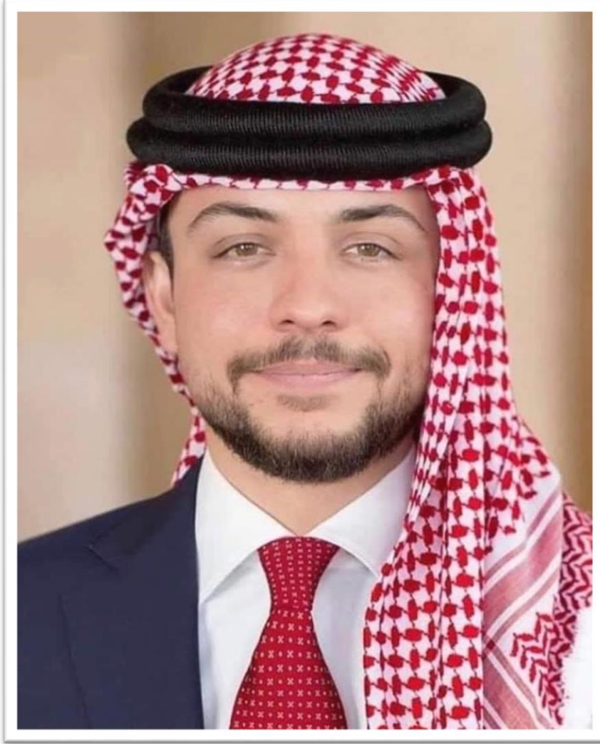
صاحب السمو الملكي الأمير حسين بن عبد الله ولي العهد