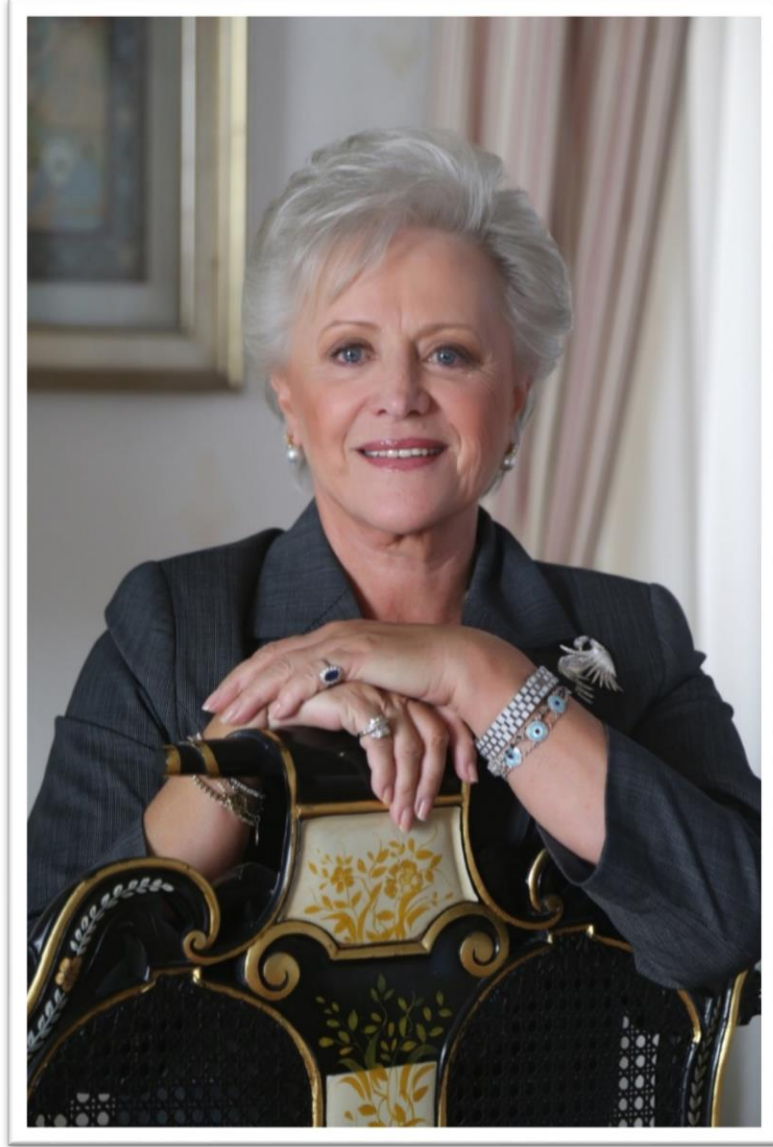
صاحبة السمو الملكي الاميرة منى الحسين المعظمة رئيس المجلس التمريضي الأردني