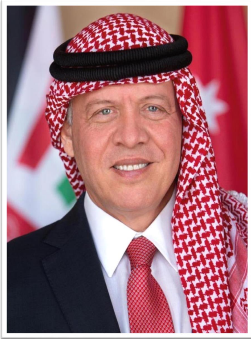
جلالة الملك عبد الله الثاني ابن الحسين المعظم ملك المملكة الأردنية الهاشمية